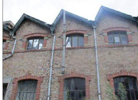
Le moulinage Vacher, rue de Bellevue, est typique du style duniérois avec ses murs en pierre et ses encadrements de baies en brique. À travers les fenêtres du haut, on aperçoit les parties vitrées du toit en sheds.

Les industries duniéroises se sont d'abord développées le long de la Dunière, pour exploiter la force de l'eau. En suivant le cours de la rivière, on peut encore voir, témoignant de cette activité, des canaux, des levées (petits barrages, comme sous le viaduc de Faurie ou à Bertholet) et plusieurs moulinages, plus ou