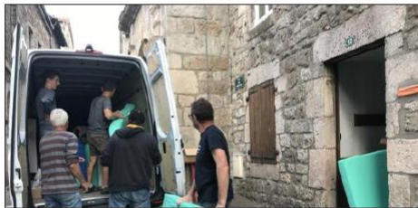
Ce jeudi les bénévoles étaient à l'action

Chez les bénévoles qui depuis des semaines assurent la gestion, le transport et la livraison sur place, la volonté est toujours très présente.