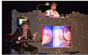
Le Voyage de Léa, en chansons et musiques du monde.

Pour sa rentrée 2022, l'Emihl (École de musique intercommunale du Haut-Lignon) a très copieusement rempli les gradins du Calibert, mercredi après-midi. Divisé en trois parties, ce moment s'inscrivait dans le off pour le jeune public du festival